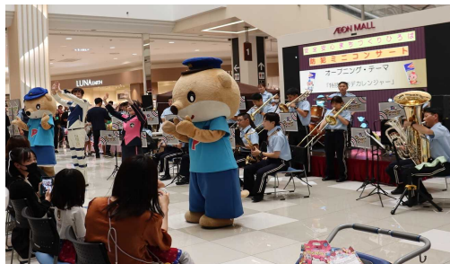
県警察音楽隊による防犯ミニコンサート