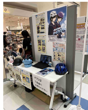
各種啓発パネルの展示