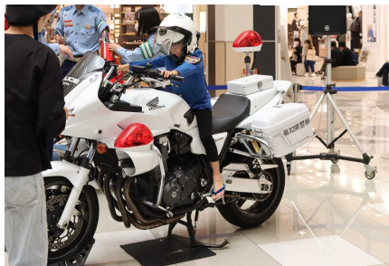
白バイの体験乗車